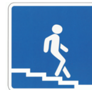
Подземный пешеходный переход

Прямоугольной формы – информационно-указательные знаки.