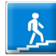
Надземный пешеходный переход

Только я для пешехода Знак на месте перехода. В голубом иду квадрате- Переходоуказатель.