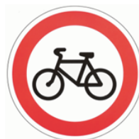
Движение на велосипедах запрещено

Запрещают знаки Разное движение: обгоны, поворот- И в красные кружочки Обводит их народ.