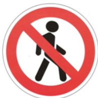
Движение пешеходов запрещено

Круглые с красным ободком - запрещающие.